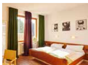
# 1 Smaragdeidchsenz.

Frühstücks-Service: Sie ordern ein Frühstück - wir bestücken Ihren Kühlschrank, damit Sie morgens im Bett, im Zimmer oder im Kastaniengarten - am eigenen Tisch - genüsslich frühstücken können. Frische Brötchen stehen an der Rezeption für Sie bereit.