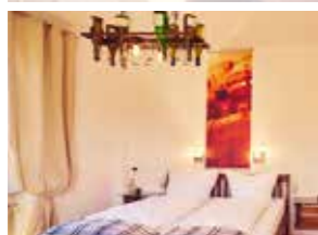
# 5 In vino veritas