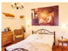
# 2 Armer Poet