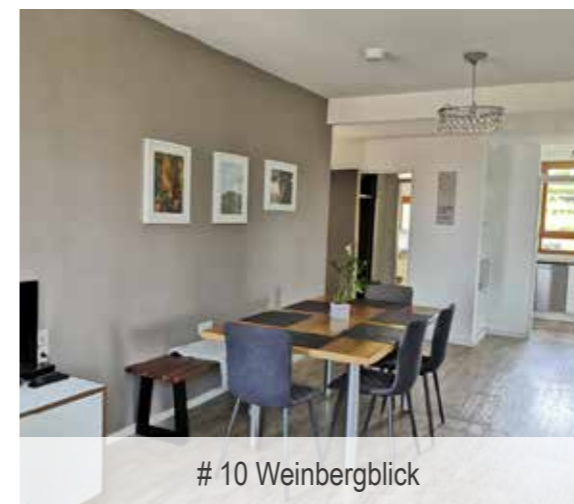
# 10 Weinbergblick