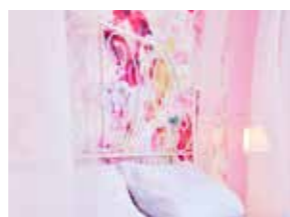
# 3 Romantikzimmer