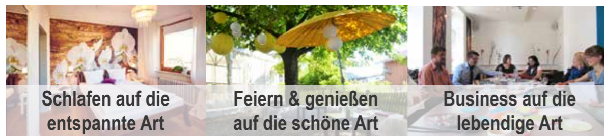
Schlafen auf die entspannte Art