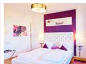
# 4 Landhaussuite