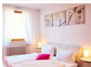
# 9 Kirschblütenzimmer