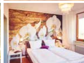
# 8 Orchideenzimmer