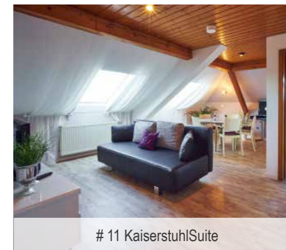
# 11 KaiserstuhlSuite